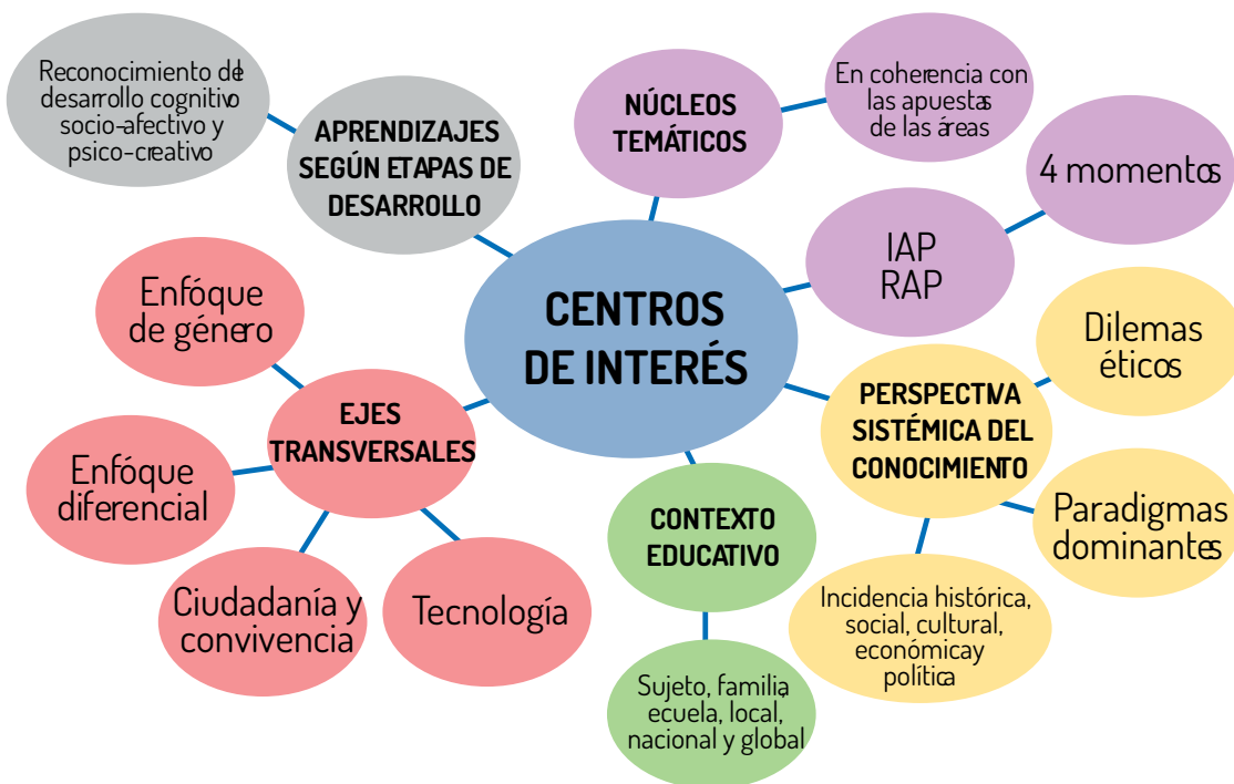
Figura 3: Aspectos que se deben tener en cuenta al planear, construir e implementar un centro de interés.

Los Centros de Interés se planean, construyen e implementan teniendo en cuenta los siguientes aspectos (ver figura 3):