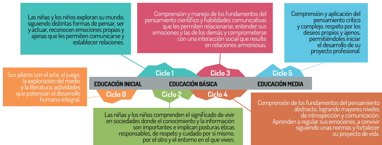
Figura 1. Currículo integral y sostenible 40x40: ciclos y niveles

En la figura 1 se evidencia la articulación de los ciclos y su intencionalidad integradora en la construcción de sujeto integral, en el desarrollo de sus dimensiones: cognitiva, físico-creativa y socio-afectiva y ciudadana: